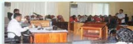
GFAL Orientation Basilan Sangguniang Panlalawigan Hunyo 24