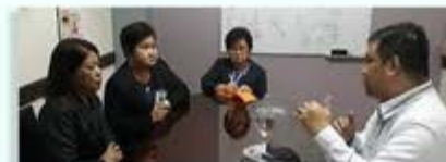
GFAL Discussion/Meeting Representatives from Southern Philippines Medical Center Hulyo 22