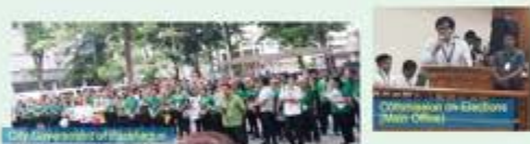
July 15 - GFAL and GESP sa flag raising ceremonies