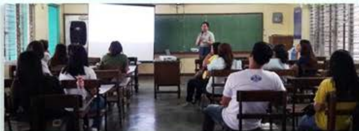
GFAL Caravan Sindalan High School, San Fernando Mayo 22