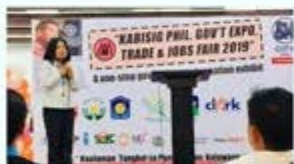
GFAL Information Dissemination KABISIG Phil. Gov't Expo Trade and Jobs Fair 2019, SM City Cebu Hulyo 17-18