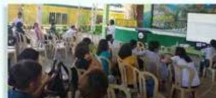
GFAL Caravan Talipan National High School, Pagbitao Hunyo 14