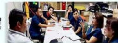
GFAL Discussion/Meeting Representatives from DOH Region XI Hulyo 22