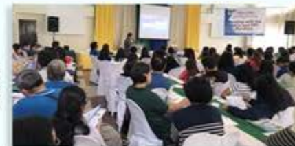
WebMSP Training, Meeting with AAOs and ERF Handlers Royal Blooms Hotel, Sta. Cruz Hulyo 16